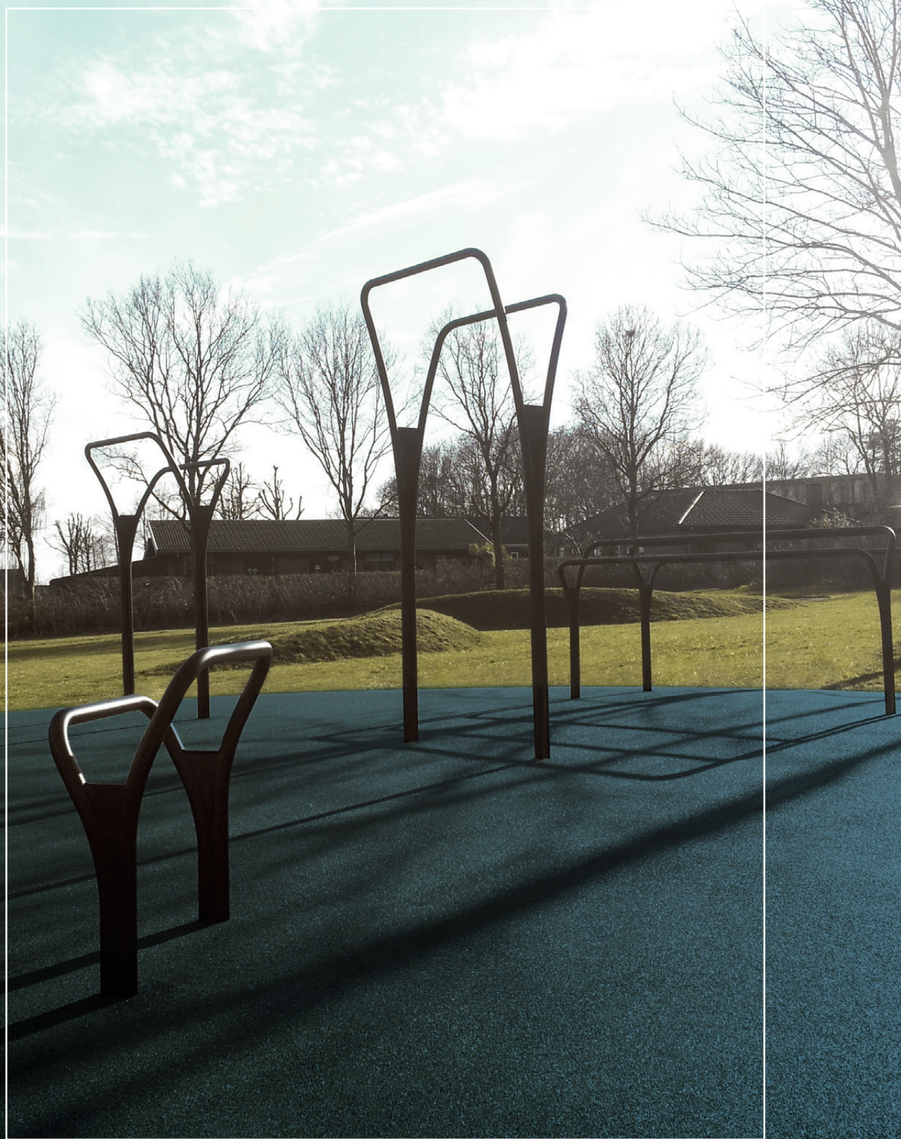
GJELLERUP / HERNING